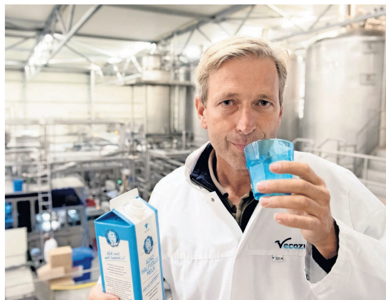
▲ 'Melkveeouders produceren zoveel als ze kunnen zonder te kijken of het product verkocht kan worden.'

Melkveeouders produceren zoveel als ze kunnen zonder te kijken of het product verkocht kan worden. Als alle melkveeouders dit begrijpen, zouden ze erbij gebaat zijn om gezamenlijk wereldwijd de melk te verkopen. Dit kan eenvoudig met een internetplatform, die zijn tegenwoordig makkelijk te maken. De melkveehouder mag dan geen melk aan andere partijen leveren en niet méér dan afgesproken. Zodra 90 procent van